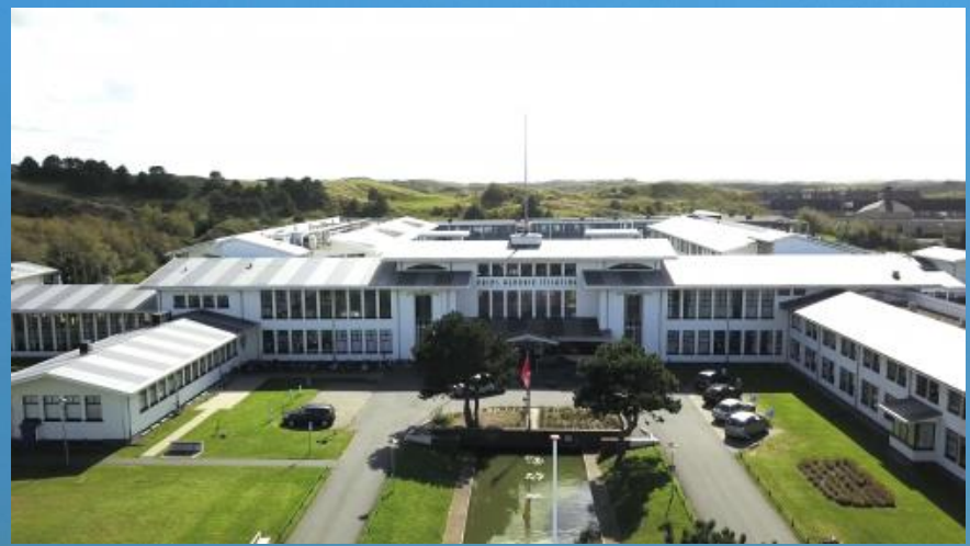
2020: 150 bewoners met dementie