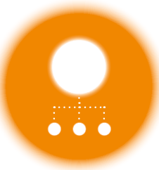
TERUG Schema p. 5