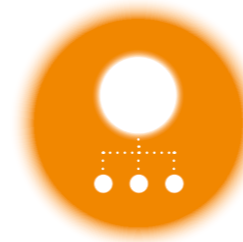
TERUG Schema p. 5

Horizon Zorgcentrum De Zorgcirkel Woonzorggroep Samen Vrijwaard (is bestuurlijk gefuseerd met Omring) Zorggroep Tellus Omring WarmThuis ViVa!Zorggroep Wilgaerden Martha Flora Hoorn St. NiKo Alkcare Geriant De Pieter Raat Stichting Magentazorg JonkersZorg